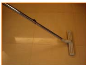
連接馬毛掃地吸頭， 執行地板吸塵工作