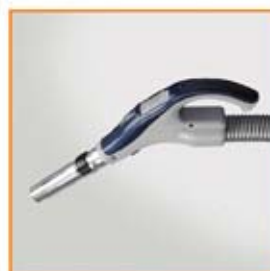
握把控制開關往前推