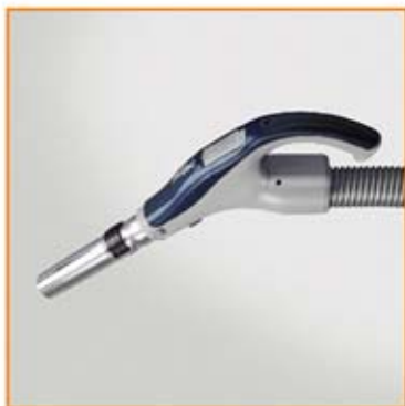
流線形握把附開關