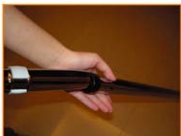
握把前端插入金屬伸縮桿