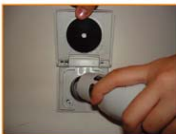
將軟管插入牆壁活門