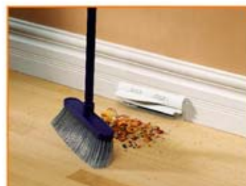
踢腳板垃圾吸入口