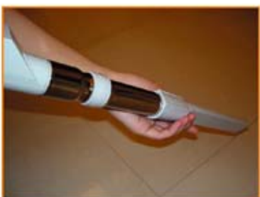
安裝尖嘴角落吸頭