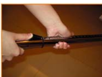
金屬伸縮桿調整長度